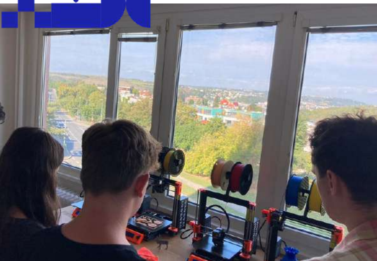
Foto: iKAP II – Inovace, natáčení videa o 3D tisku, Akademie řemesel Praha - SŠT.