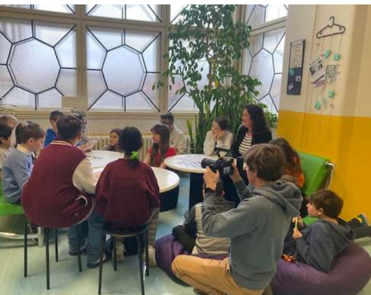
Foto: iKAP II – Inovace, natáčení videa o žákovských parlamentech, ZŠ U Vršovického nádraží, spolupráce s CEDU.