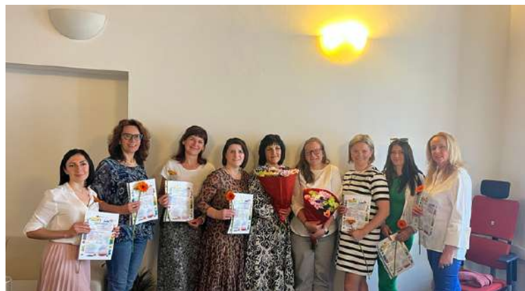
Kurz pro asistentky pedagoga.