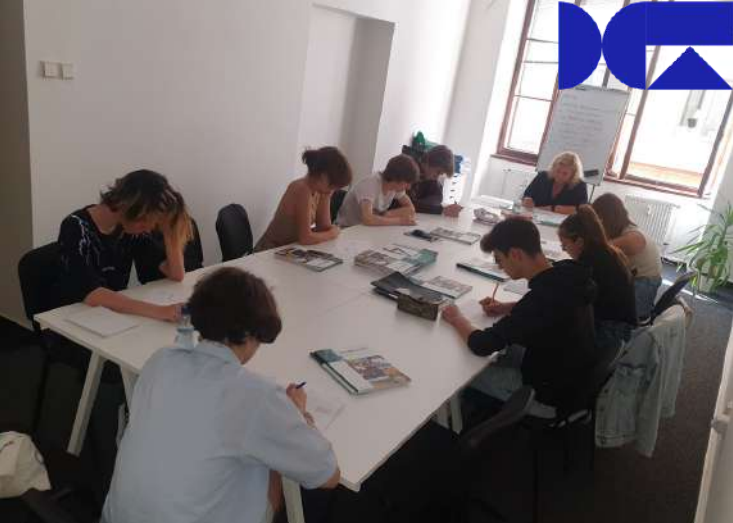
Foto: iKAP II – Inovace, kurz českého jazyka pro ukrajinské děti v Pii.