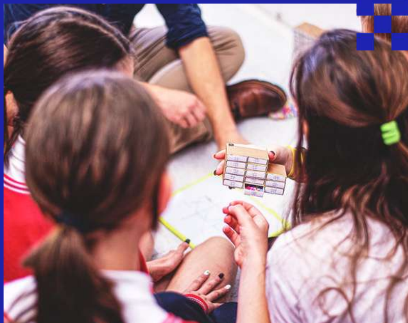
Foto: AI dětem, projektový den v rámci iKAP II – Inovace.

www.ikap2inovace.cz , www.prazskyinovacniiinstitut.cz/projekty/ikap2