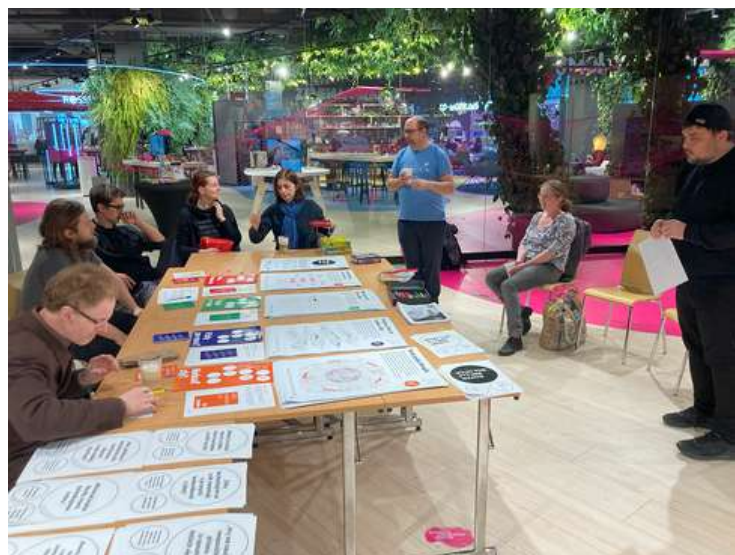
Foto: Elixír do škol, setkání učitelů v Magenta Experience Center.

Určitě stojí za zmínku, jak jsme ovlivnili cílovou skupinu: celkem jsme podpořili 542 škol, 460 pedagogů a 3 000 žáků .