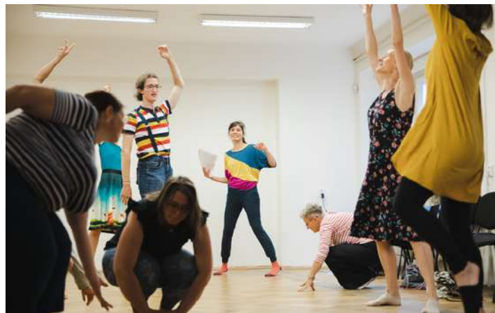
workshop Rytmus do školy patří.

Mentorský program probíhající pod křídly Společnosti pro kreativitu ve vzdělávání přinesl pedagogům mnoho nových nápadů a posílení sebevědomí. Mentorský program pro pedagogy je novým modelem podpory kreativního vzdělávání na školách, jehož funkčnost SPKV v rámci projektu iKAP II – Inovace testovala. V pozici mentorek na pražských základních a středních školách působilo osm umělkyně z různých uměleckých oblastí, které podpořily či nadále podporují necelou dvacítku pedagogů. Program prokázal přínosy spolupráce pedagogů s umělci pro rozvoj kreativní praxe pedagogů, profesně obohatil mentorky a nastínil další možnosti a výzvy pro vývoj a realizaci mentorského programu. Výstupem programu bude metodika s doporučeními (nejen) pro pedagogy a příklady dobré praxe. Materiály budou dostupné na konci roku 2023 na webu spkv.education . Více o dvouletém programu mentoringu se dočtete na webu SPKV zde .